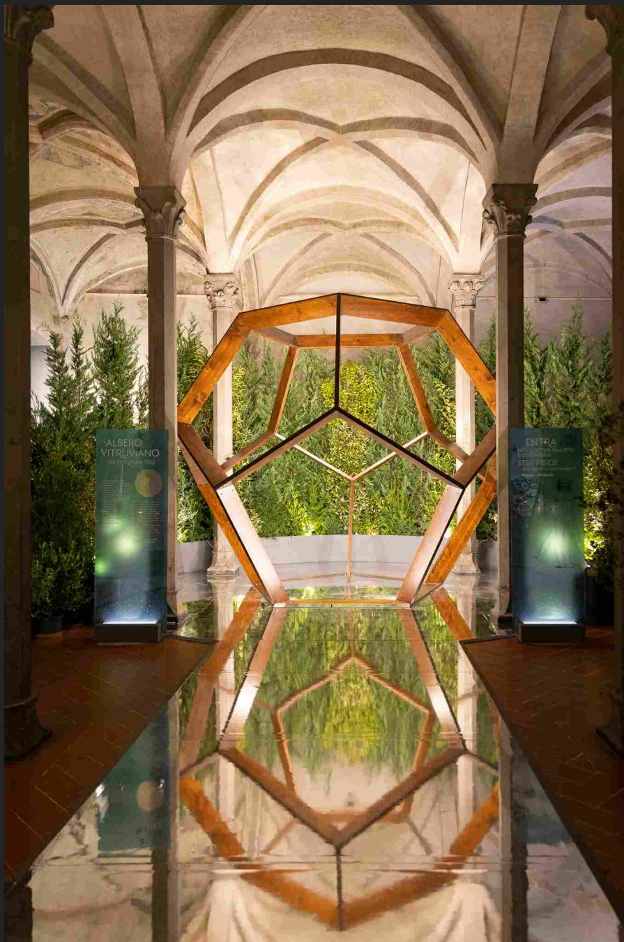
Aboca | Dalla mostra La Botanica di Leonardo

healthcare company toscana, con il coordinamento scientifico e l'organizzazione di MUS.E, l'associazione in-house del Comune di Firenze che cura la valorizzazione del patrimonio dei Musei civici fiorentini.