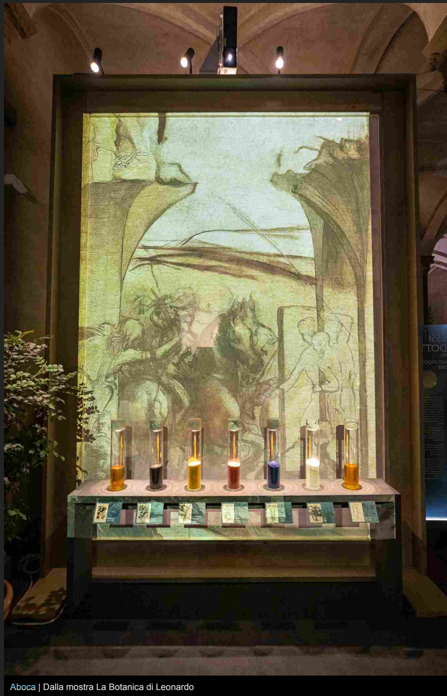
Aboca | Dalla mostra La Botanica di Leonardo

Dai meravigliosi disegni di Windsor ai delicati schizzi nei suoi taccuini, dagli appunti sulla morfologia e sulla fisiologia botanica alla specifica trattazione nel Libro della Pittura , le tracce che Leonardo ci ha lasciato del suo interesse verso il mondo vegetale offrono un punto di vista inedito tanto sul suo pensiero quanto sulla sua eredità.